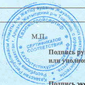
Схема сертификации № 7.

Подпись руководителя органа по подтверждению соответствия или уполномоченного им лица